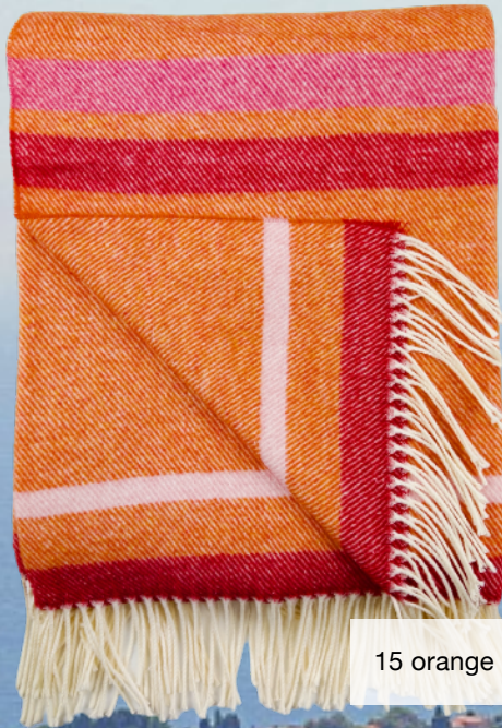
15 orange pink gestreift