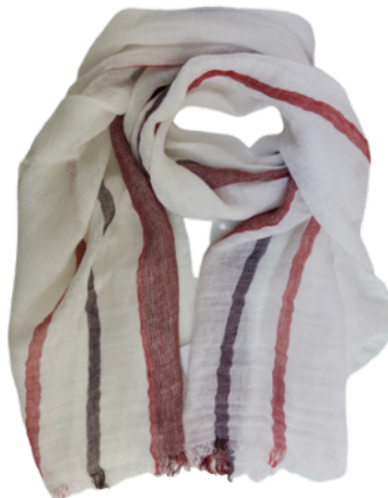
06 weiß rot blau