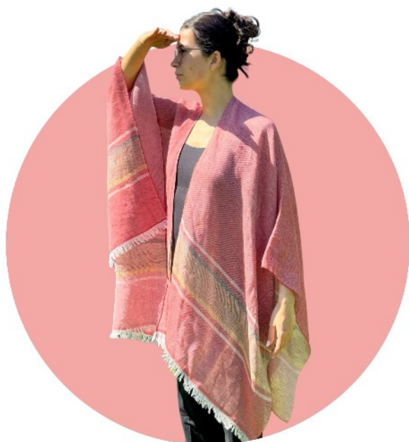
06 rot - gelb - braun