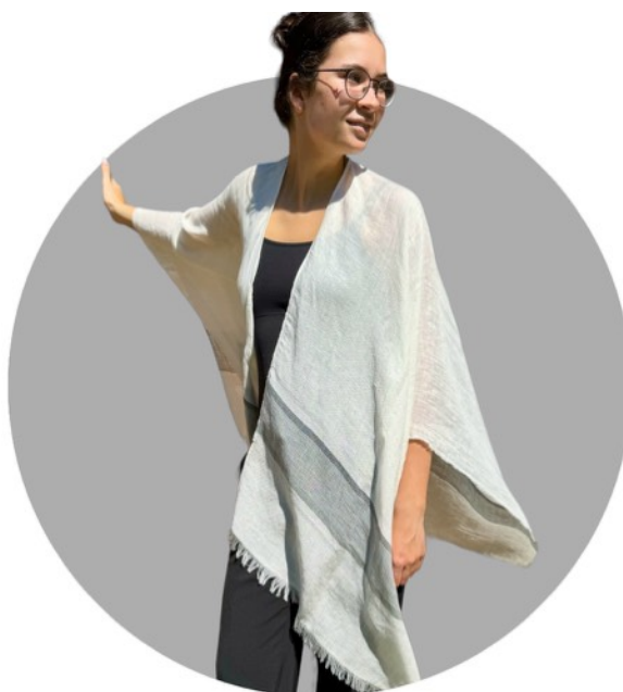
01 weiß - grau - silber