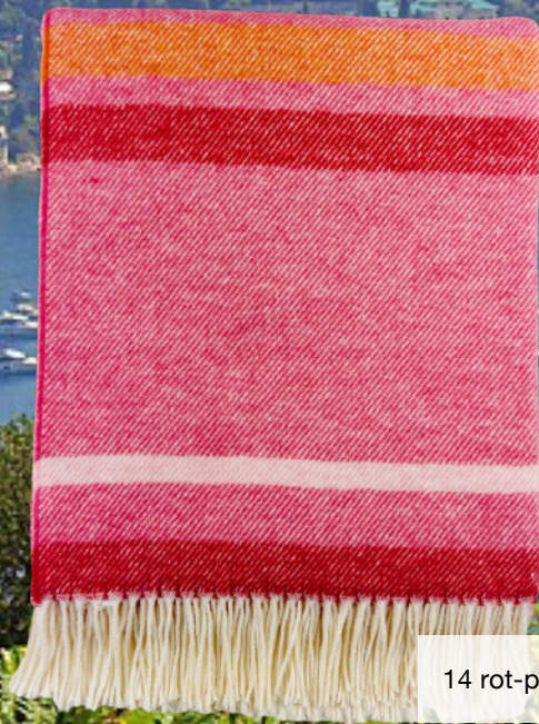
14 rot-pink gestreift