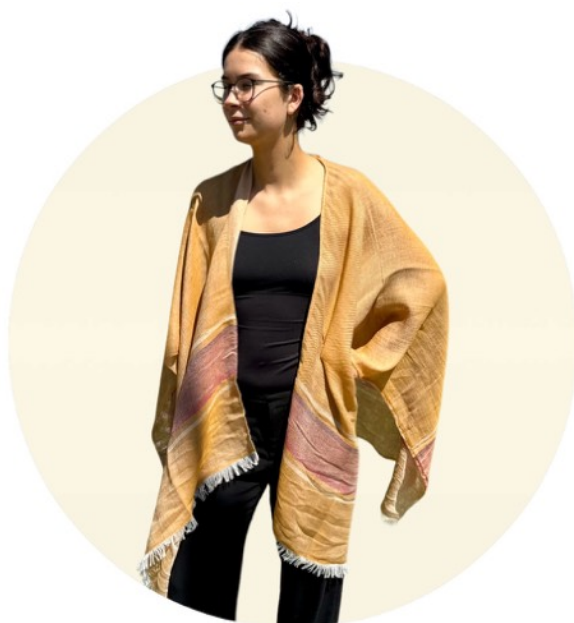
07 rot - gelb - braun