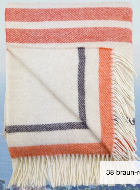
38 braun-rot gestreift