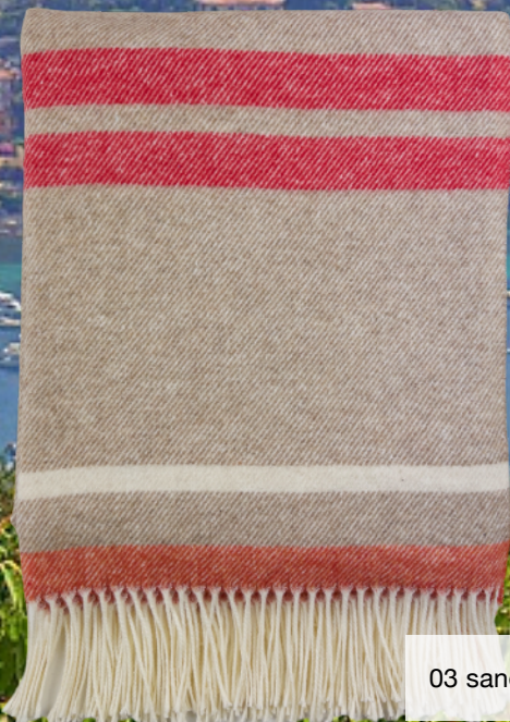
03 sand gestreift